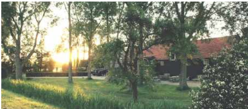
› Landgoed Twistvliet Zeeland

Vergaderen in een nieuwe omgeving kan leiden tot meer inspiratie en het tot stand komen van ideeën. We kiezen dan ook voor een authentieke en rustgeven locatie.