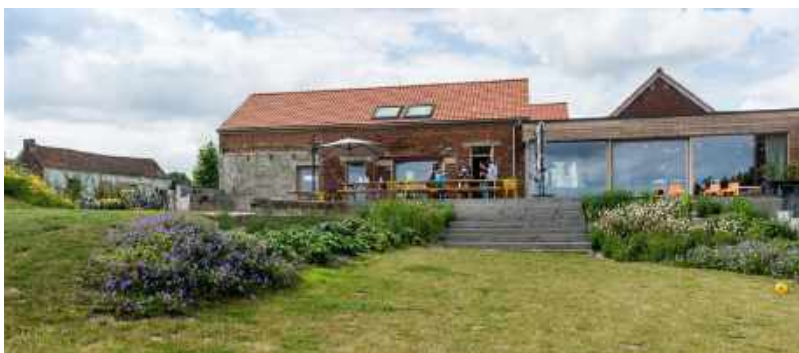
› Vakantiewoning Samuus Vlaamse Ardennen