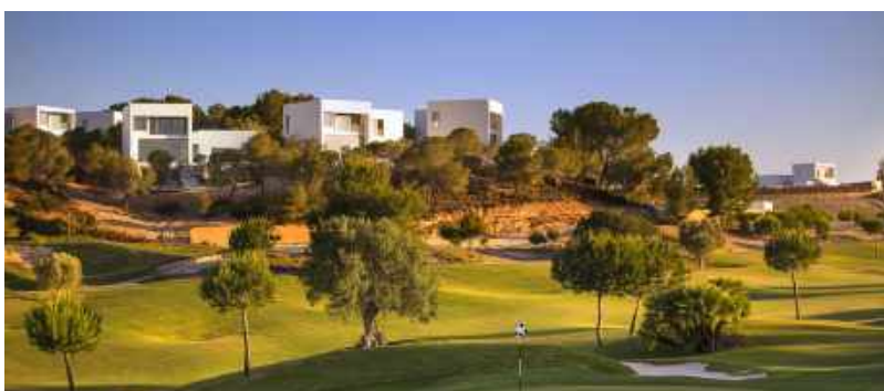
› Las Colinas Golf Alicanté